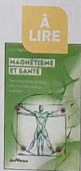
(3) Magnétisme et santé Daniel Kieffer Éd. Jouvence, 2023, 19,95 €

à partir d'un témoin énergétique de la personne : ongle, cheveu, vêtement, photo argentique... », cela afin d'amplifier le lien dans l'invisible entre le guérisseur et le praticien. Mais les facteurs de guérison restent encore profondément énigmatiques... Alors Daniel Kieffer en appelle-t-il au discernement : attention à certains magnétiseurs, « à des cursus parfois fantaisistes, sans déontologie, sans formation le risque est également celui d'éloigner le patient d'un parcours médical qui pourrait s'avérer nécessaire ». La consultation d'un professionnel de santé reconnu est un prérequis indispensable à tout diagnostic pathologique. Ainsi, certaines méthodes malencontreuses pourraient contribuer à jeter le crédit sur une pratique qui a pourtant fait ses preuves. Si ce monde est en perpétuelle évolution, chaque cycle nous offre sa vision, reflétant à la fois les innovations de la science et notre profond besoin de tradition : le magnétisme n'échappe pas à la règle. En redécouvrir les racines va sans nul doute nous permettre de bénéficier de ses vertus pour répondre aux enjeux de santé, encore si importants à notre époque. ●