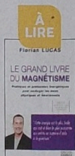
(1) Le grand livre du magnétisme Florian Lucas Éd. Exergue, 2022, 23,90 €