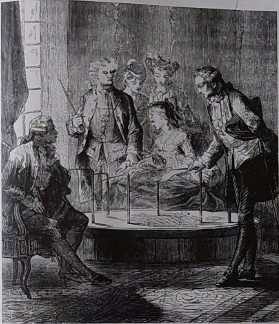
Le baquet de Mesmer, 1890, artiste inconnu.

sur un meuble la courbe de mesmer de Pley